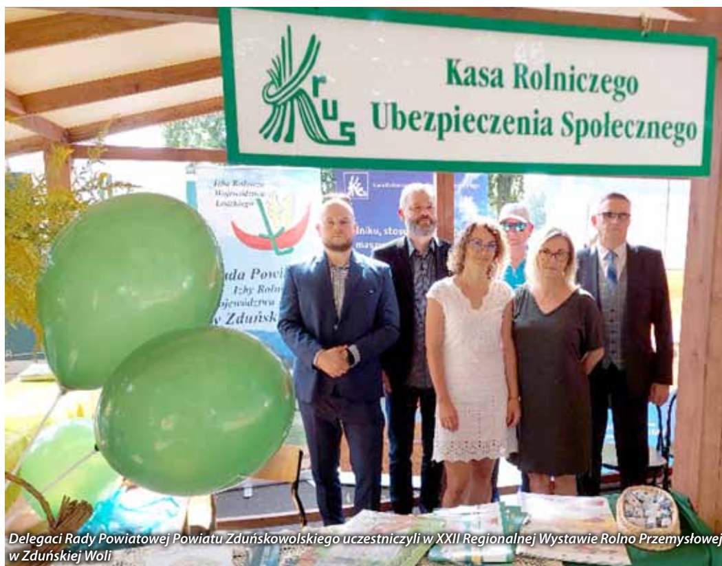
Delegacja Rady Powiatowej Powiatu Zduńskowolskiego uczestniczyła w XXII Regionalnej Wystawie Rolno Przemysłowej w Zduńskiej Woli