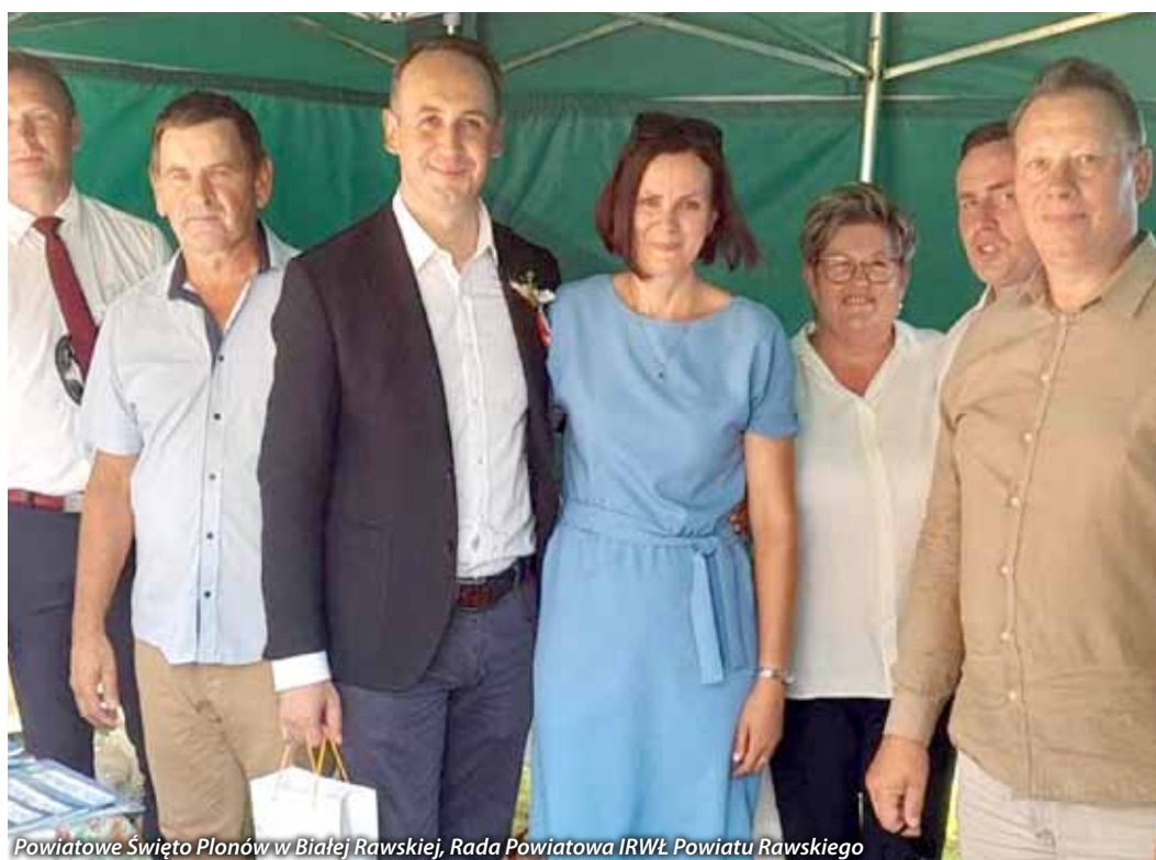
Powiatowe Święto Plonów w Białej Rawskiej, Rada Powiatowa IRWŁ Powiatu Rawskiego

W dniu 27 sierpnia 2022r. Izba Rolnicza Województwa Łódzkiego zorganizowała „Święto Owoców i Warzyw” (sfinansowanego z Funduszu Promocji Owoców i Wa-