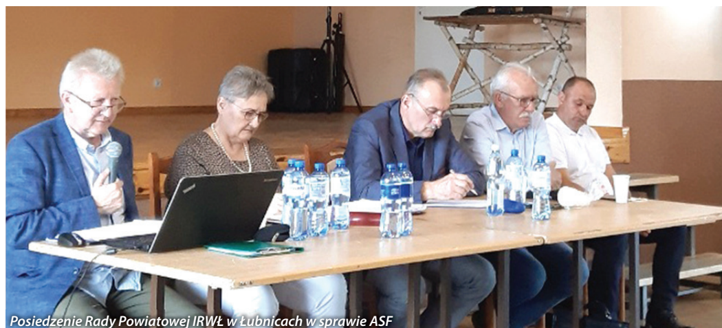
Posiedzenie Rady Powiatowej IRWŁ w Łubnicach w sprawie ASF

W dniu 16 lipca 2021r. Zarząd Izby Rolniczej Województwa Łódzkiego w związku z sygnałami od rolników w sprawie trudności w zakupie nawozów azotowych oraz wieloskładnikowych skierował pismo do Prezesa KRIR o podjęcie działań interwencyjnych.