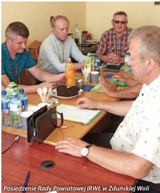
Posiedzenie Rady Powiatowej IRWŁ w Zduńskiej Woli

- ustawy o zwrocie podatku akcyzowego zawartego w cenie oleju napędowego wykorzystywanego do produkcji rolnej;