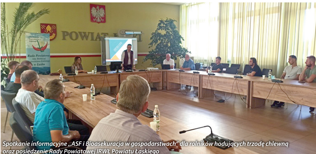
Spotkanie informacyjne „ASF i Bioasekuracja w gospodarstwach” dla rolników hodujących trzodę chlewną oraz posiedzenie Rady Powiatowej IRWŁ Powiatu Łaskiego

Wszystkie działania, interwencje podejmowane przez Zarząd Izby Rolniczej Województwa Łódzkiego oraz odpowiedzi na wnioski zgłoszone przez IRWŁ oraz informacje na temat sytuacji w rolnictwie są dostępne na stronie internetowej IRWŁ www.izbarolnicza.lodz.pl