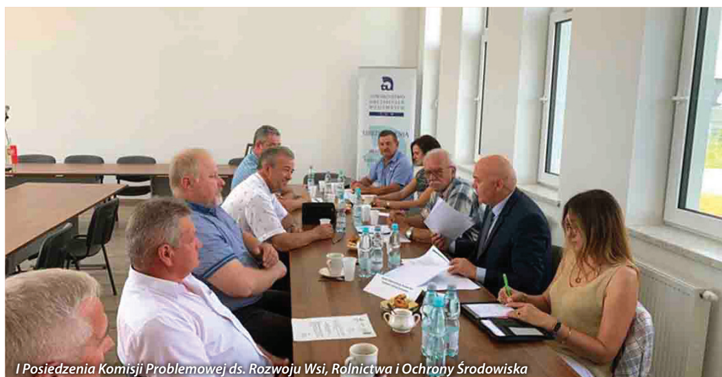
I Posiedzenia Komisji Problemowej ds. Rozwoju Wsi, Rolnictwa i Ochrony Środowiska