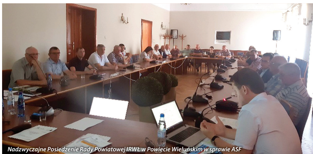
Nadzwyczajne Posiedzenie Rady Powiatowej IRWŁ w Powiecie Wieluńskim w sprawie ASF

W związku z wystąpieniem ASF powiat sieradzki objęty jest niebieską strefą. Obecnie Polski Związek Łowiecki – Zarząd Okręgowy w Sieradzu wstrzymał odstrzał dzików ze względu na brak miejsca w chłodniach gdzie przechowywane jest mięso. Obecnie odstrzał jest bardzo potrzebny w celu ograniczenia szkód wyrządzanych przez dziki jak również w celu ochrony gospodarstw przed ASF. Brak