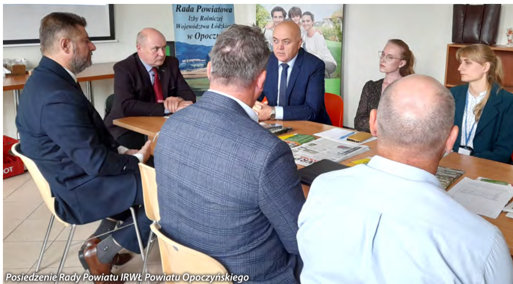
Posiedzenie Rady Powiatu IRWŁ Powiatu Opczyńskiego