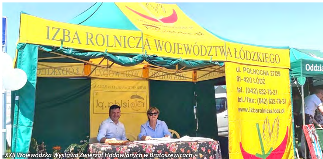
XXII Wojewódzka Wystawa Zwierząt Hodowlanych w Bratoszewicach