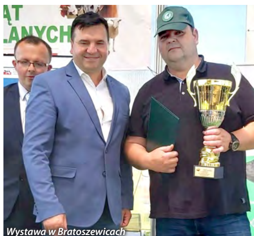
Wystawa w Bratoszewicach

Półkolonie rozpoczęły się w dniach 27.06. - 08.07.2022 roku w Szkole Podstawowej im Marii Kopnickiej w Buczku, ul. Szkolna 3, 98-113 Buczek.