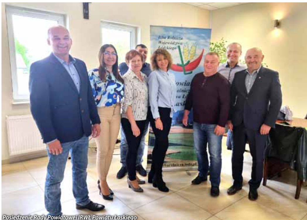
Posiedzenie Rady Powiatowej IRWŁ Powiatu Łaskiego

kupu nawozów mineralnych do 30.06.2023r. Aktualna propozycja terminu zakupu nawozu mineralnego, jaką rolnik ma udokumentować to termin od 16.05.2022r do 31.03.2023r. Ceny nawozów w dalszym ciągu są wysokie. Nawozy azotowe w Polsce są droższe niż w sąsiednich państwach UE. Jeśli chodzi o użytki zielone, rolnicy nawozy azotowe stosują najczęściej do końca sierpnia.