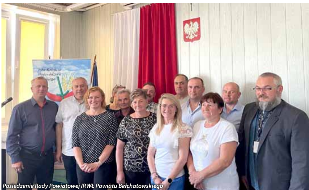
Posiedzenie Rady Powiatowej IRWŁ Powiatu Bełchatowskiego

5. Podjąć ponowne działania mające na celu zablokowanie importu mleka i produktów mlecznych. Na rynku polskim ceny skupu mleka windują w dół. Może to doprowadzić do bankructwa niektórych producentów mleka, a w dalszej perspektywie odejście od produkcji mlecznej.