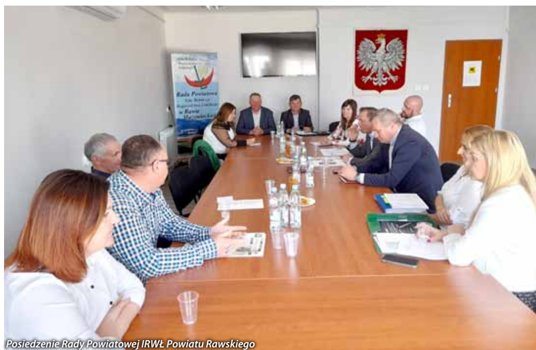
Posiedzenie Rady Powiatowej IRWŁ Powiatu Rawskiego

woju Wsi, Rolnictwa i Ochrony Środowiska. Podjąć działania mające na celu przedłużenie terminu za-