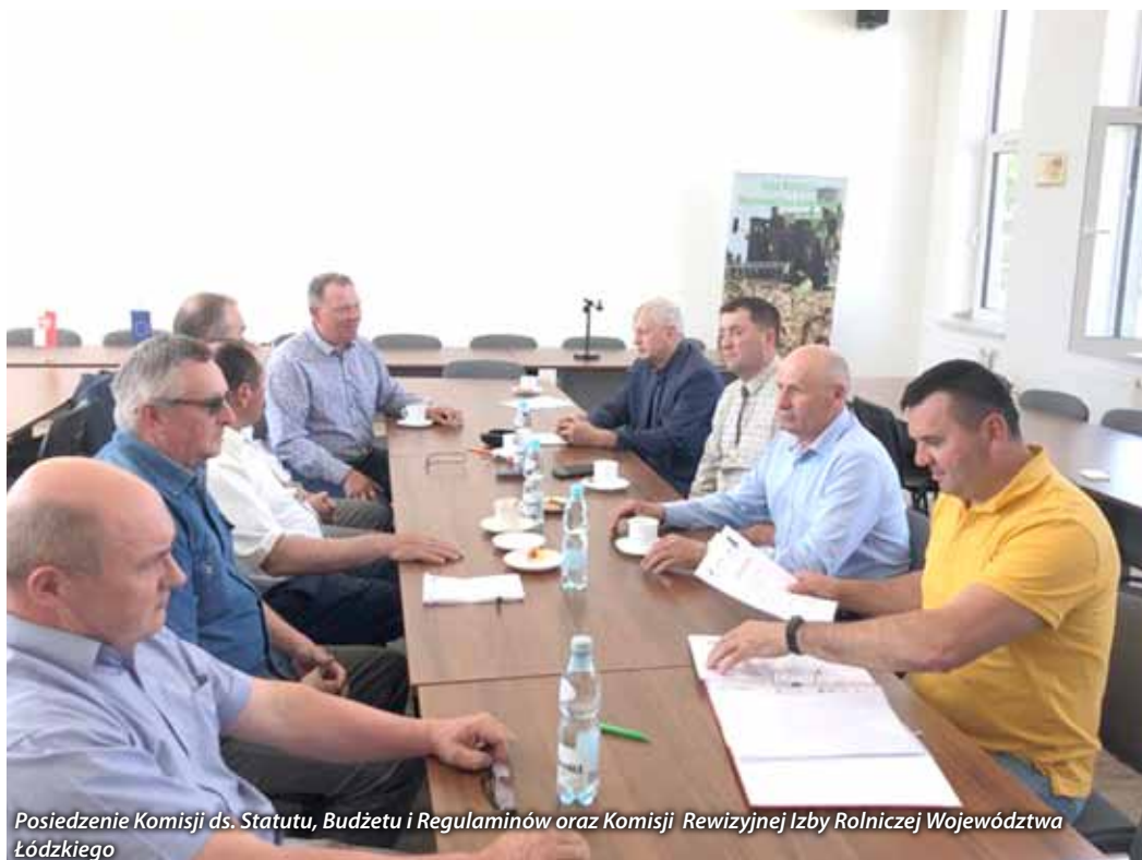
Posiedzenie Komisji ds. Statutu, Budżetu i Regulaminów oraz Komisji Rewizyjnej Izby Rolniczej Województwa Łódzkiego

W dniu 19 maja 2023 r. w sali konferencyjnej Izby Rolniczej Województwa Łódzkiego odbyło się posiedzenie Komisji. Członkowie omówili trudną