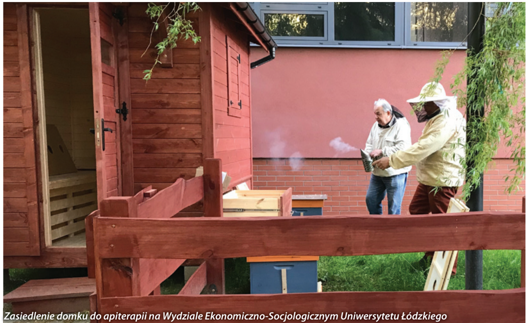
Zasiedlenie domku do apiterapii na Wydziale Ekonomiczno-Socjologicznym Uniwersytetu Łódzkiego

W ostatnich latach liczba pszczół drastycznie się zmniejsza. Dlatego konieczne jest dbanie o rozwój pasiek. Pszczoły są jednym z najważniejszych owadów w przyrodzie. Zapylają większość użytkowanych przez człowieka roślin i są niezwykle ważną częścią ekosystemu oraz jednym z ważniejszych czynników plonotwórczych w produkcji roślinnej.