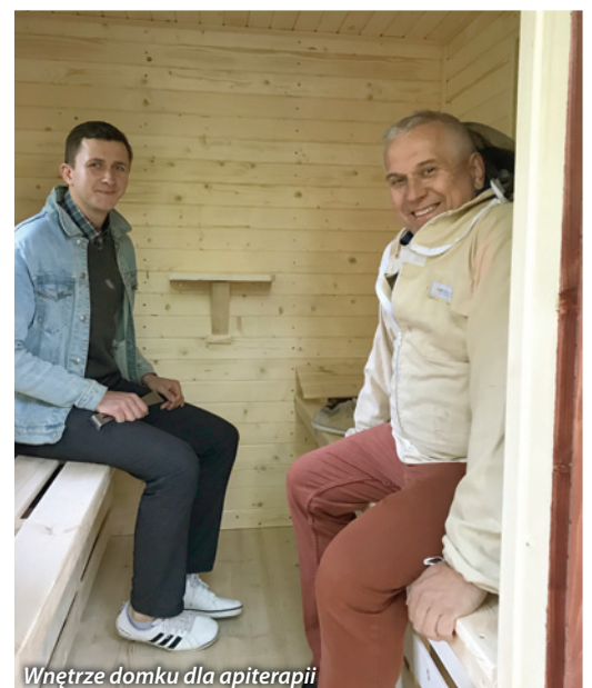
Wnętrze domku dla apiterapii

- W ramach współpracy z Uniwersytetem Łódzkim, postawiliśmy także na terenie Wydziału Ekonomiczno-Socjologicznego Uniwersytetu Łódzkiego domek do apiterapii i zasiedliliśmy go pszczołami. Zamierzamy już z początkiem czerwca postawić obok domku pięć nowych uli z rodzinami pszczelimi. Pracownicy uniwersytetu i studenci będą mogli skorzystać z wyjątkowego relaksu i odpoczynku – zachęca Prezes SPZŁ - Powietrze z uli w domku przesycone jest wyjątkowo aromatycznymi zapachami, a szum pracujących pszczoł koi nerwy. Nawet krótki pobyt we wnętrzu pozwoli się