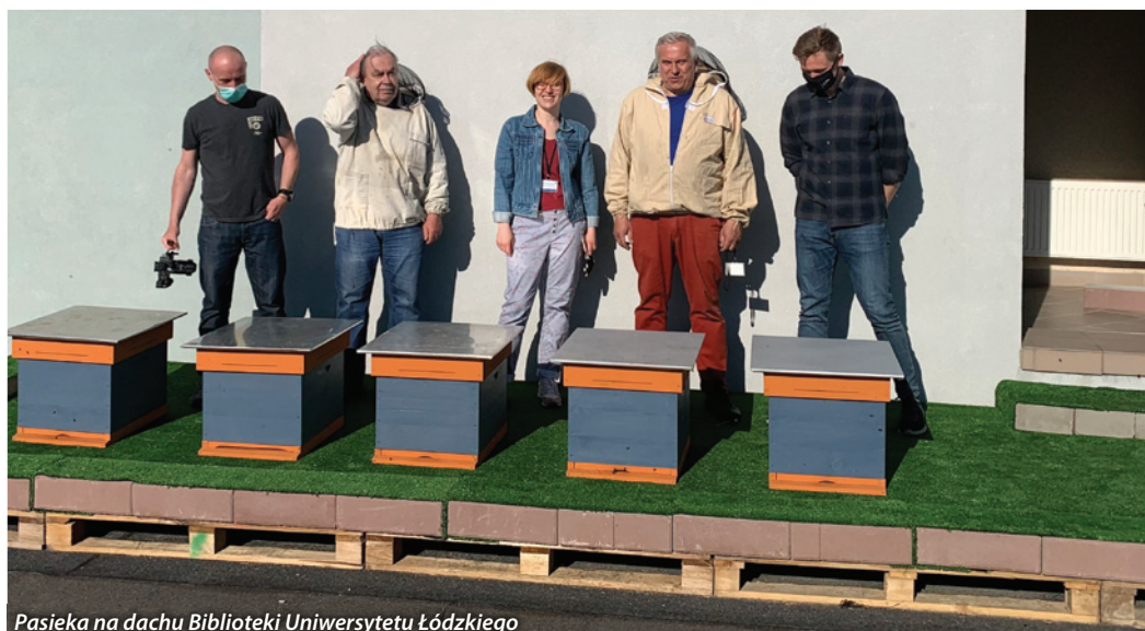
Pasieka na dachu Biblioteki Uniwersytetu Łódzkiego

wyciszyć i skoncentrować na czekających zadaniach. W dobie pandemii COVID-19 i przy częstych powikłaniach upośledzających nasz układ oddechowy, pobyt w atmosferze powietrza nasyconego aromatami wydzielanymi przez rodzinę pszczelą, spowoduje szybszą regenerację naszych płuc i powrót do pełnej sprawności.