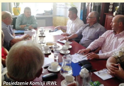
Posiedzenie Komisji IRWŁ

Niewątpliwie najważniejszym wydarzeniem w omawianym okresie było VII w piątej kadencji Walne Zgromadzenie Izby Rolniczej Województwa Łódzkiego, które odbyło się w dniu 26 maja 2018r. w sali konferencyjnej Łódzkiego Rynku Hurtowego „Zjazdowa S.A.” w Łodzi. W pierwszej części posiedzenia delegaci zatwierdzili sprawozdanie Zarządu IRWŁ z działalności statutowej oraz finansowej za rok 2017, udzieliłi absolutorium Zarządowi IRWŁ i przyjęli budżet na rok 2018r. W drugiej części obrad uczestniczyli zaproszeni goście – przedstawiciele instytucji sektora rolnego, którzy przedstawi-