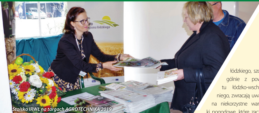
Stoisko IRWŁ na targach AGROTECHNIKA 2019