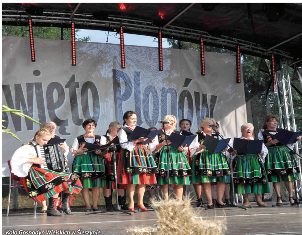
Koło Gospodyń Wiejskich w Śleszynie

Krajowy Rejestr Kół Gospodyń Wiejskich jest jawny i każdy ma prawo dostępu do danych zawartych w rejestrze oraz otrzymać nieodpłatnie poświadczony odpis, wycią-