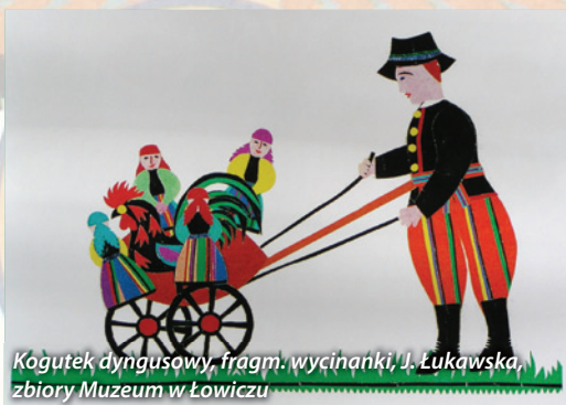
Kogutek dyngusowy, fragm. wycinanki, J. Łukawska, zbiory Muzeum w Łowiczu

Magdalena Bartosiewicz, Muzeum w Łowiczu