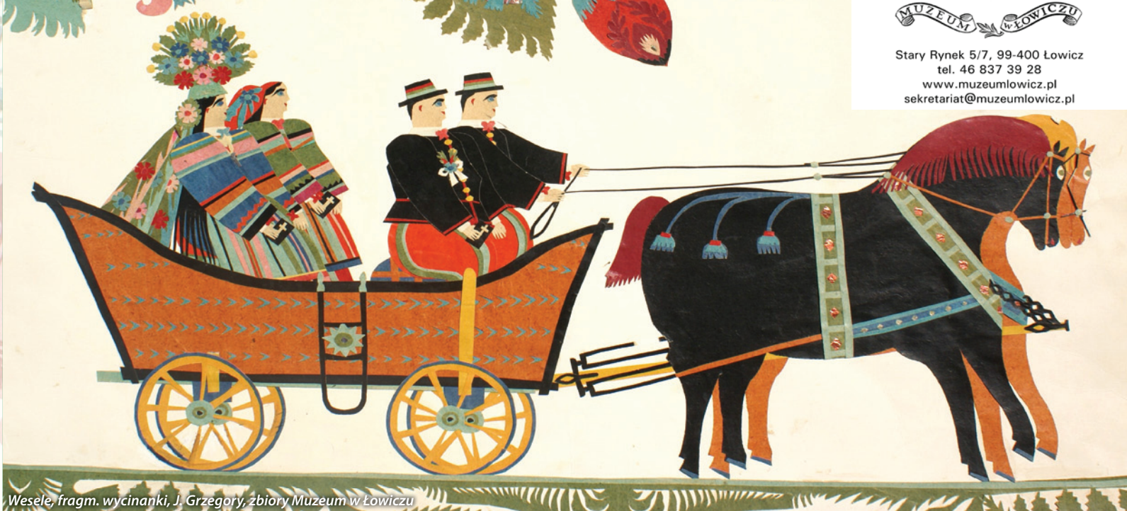
Wesele, fragm. wycinanki, J. Grzegory, zbiory Muzeum w Łowiczu

Stary Rynek 5/7, 99-400 Łowicz tel. 46 837 39 28 www.muzeumlowicz.pl sekretariat@muzeumlowicz.pl