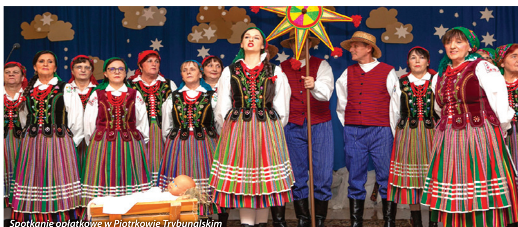
Spotkanie oplatkowe w Piotrkowie Trybunalskim

Wszystkie działania, interwencje podejmowane przez Zarząd Izby Rolniczej Województwa Łódzkiego oraz informacje na temat sytuacji w rolnictwie są dostępne na stronie internetowej IRWŁ www.izbarolnicza.lodz.pl