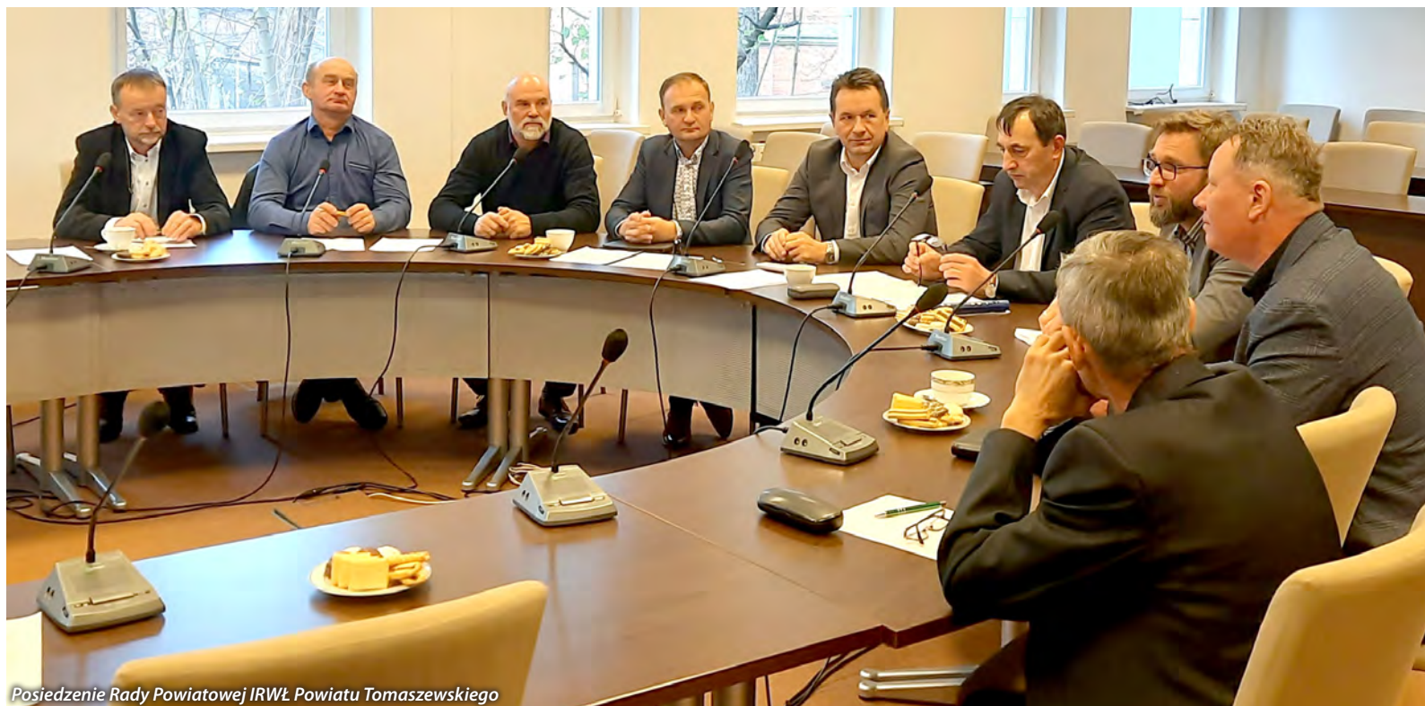
Posiedzenie Rady Powiatowej IRWŁ Powiatu Tomaszewskiego