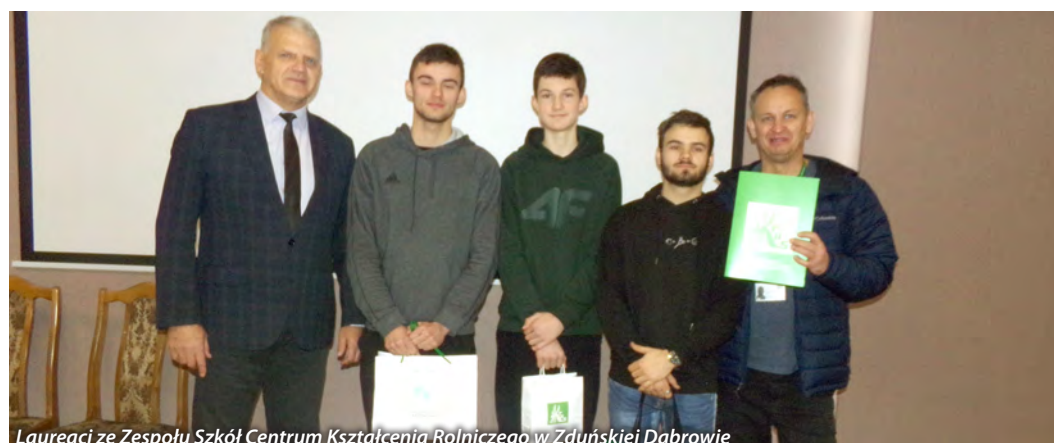
Laureaci ze Zespołu Szkół Centrum Kształcenia Rolniczego w Zduńskiej Dąbrowie