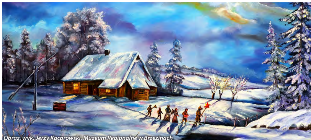
Obraz, wyk. Jerzy Kacprowski, Muzeum Regionalne w Brzezinach