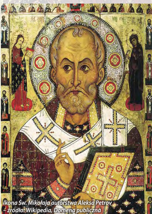
Ikona Św. Mikołaja autorstwa Aleksa Petrov - źródło: Wikipedia, Domena publiczna

Ilustracja, źródło: Fresk katedry klasztoru Ferapontov (Dionizjusz, 1502), źródło: Wikipedia