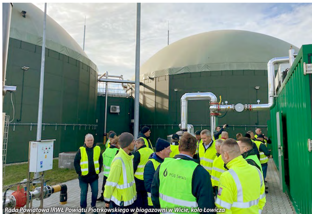
Rada Powiatowa IRWŁ Powiatu Piotrkowskiego w biogazowni w Wicie, koło Łowicza

W dniu 7.11.2022r. Rada Powiatowa Izba Rolnicza Województwa Łódzkiego Powiatu Piotrkowskie-