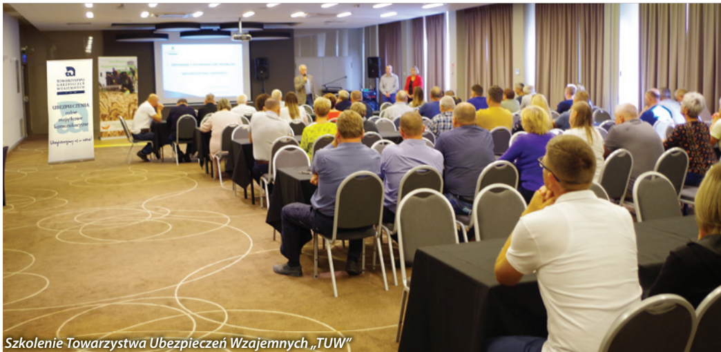
Szkolenie Towarzystwa Ubezpieczeń Wzajemnych „T UW”

Izba Rolnicza Województwa Łódzkiego, co roku organizuje wyjazd studyjno-szkoleniowy dla rolników województwa łódzkiego. Niestety w listopadzie 2020 roku wyjazd nie mógł się odbyć z powodu pandemii COVID-19, dlatego w tym roku zorganizowano go już we wrześniu.