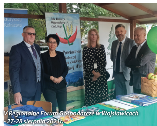
V Regionalne Forum Gospodarcze w Wojstawicach 27-28 sierpnia 2021r.

W dniu 10 września 2021 r. odbył się jubileusz 25-lecia działalności Krajowej Rady Izb Rolniczych. Więcej informacji na str. 8-9.