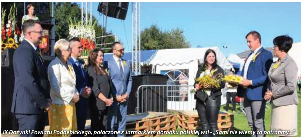
IX Dożynki Powiatu Poddębickiego, połączone z Jarmarkiem dorobku polskiej wsi - „Sami nie wiemy co potrafimy...”