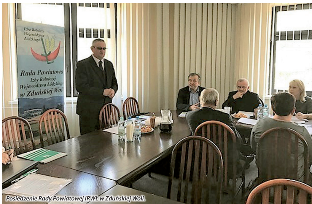
Posiedzenie Rady Powiatowej IRWŁ w Zduńskiej Woli.

warunków i trybu przyznawania wypłaty oraz zwrotu pomocy finansowej na operację typu „Restrukturyzacja małych gospodarstw” w ramach poddziałania „Pomoc a rozpoczęcie działalności gospodarczej na rzecz rozwoju małych gospodarstw” objętego PROW na lata 2014-2020;