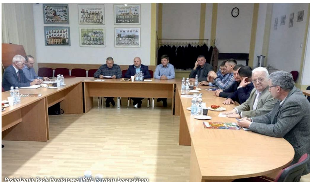
Posiedzenie Rady Powiatowej IRWŁ Powiatu Łęczyckiego