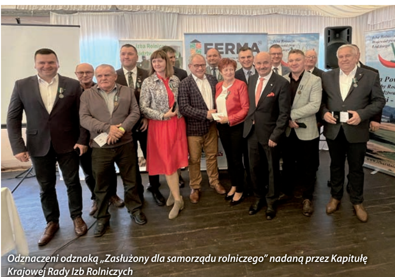
Odnaczeni odznaką „Zasłużony dla samorządu rolniczego” nadaną przez Kapitułę Krajowej Rady Izb Rolniczych