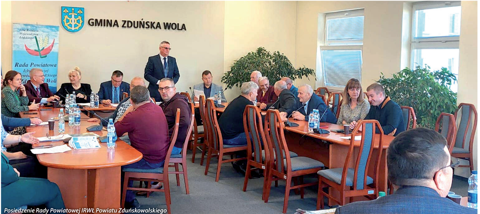
Posiedzenie Rady Powiatowej IRWŁ Powiatu Zduńskowolskiego