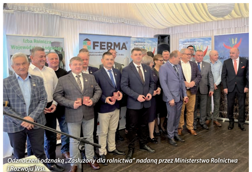
Odnaczeni odznaką „Zasłużony dla rolnictwa” nadaną przez Ministerstwo Rolnictwa i Rozwoju Wsi.