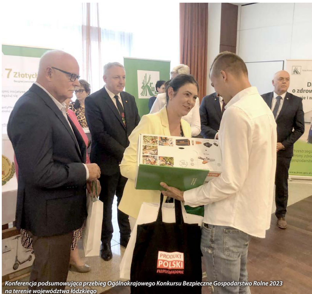
Konferencja podsumowująca przebieg Ogólnokrajowego Konkursu Bezpieczne Gospodarstwo Rolne 2023 na terenie województwa łódzkiego

Zarząd Izby Rolniczej Województwa Łódzkiego wydał opinie w sprawie przekształcenia gruntów leśnych na cele nieleśne i gruntów rolnych na cele nierolnicze.