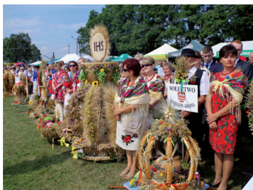
Dożynki Wojewódzkie w Sędziejowicach