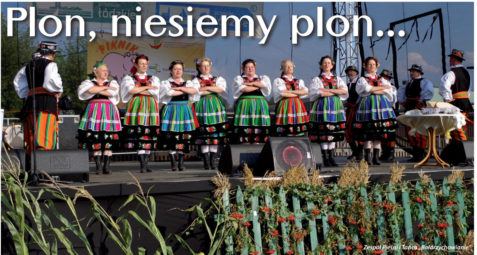
Zespół Pieśni i Tańca „Bałdrzychowianie”